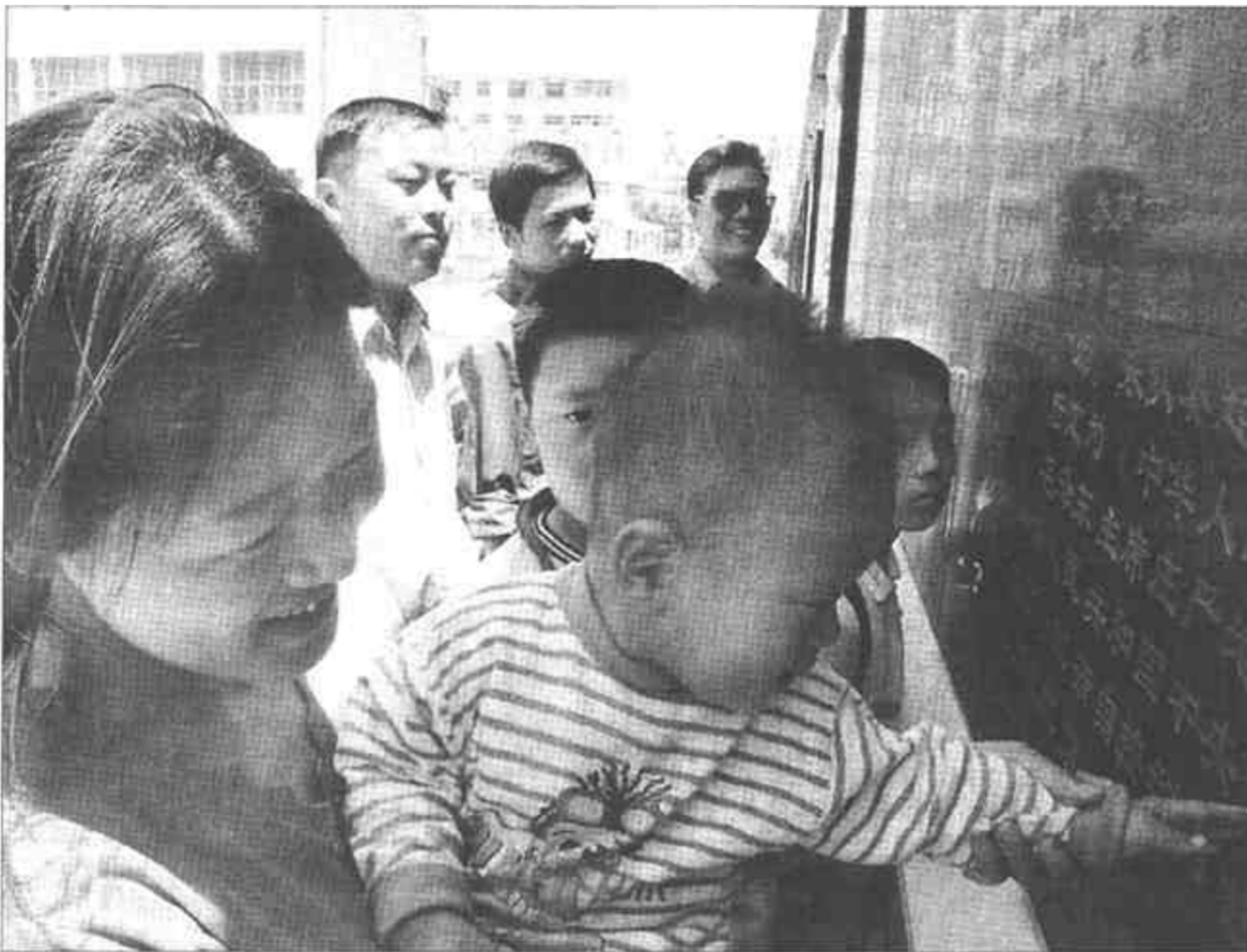
广饶县电业局以家庭文化“五个一”、“大院文化”、“五个一”、“记载文化”、“五个一”、职工档案“五个一”的“四五一”工程为载体,努力实施企业文化战略,增强了职工的主人翁意识,增强了企业的凝聚力和向心力,促进了各项工作