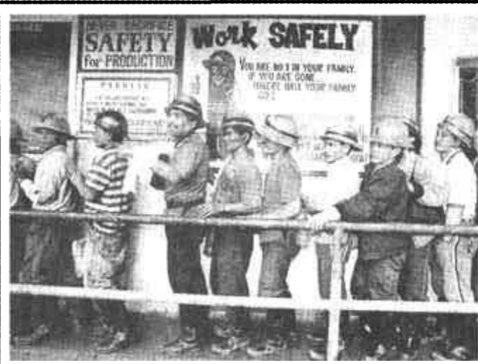
6月22日,在菲律宾吕宋岛本格特省曼卡扬镇的一个金矿工地,矿工们正在等待搜身。这里的金矿主为了防止有人将矿石偷带离矿,规定每个矿工必须接受全面的搜身检查后才能下班离矿。

据新华社伦敦6月22日电(记者 黄兴伟)据英国广播公司22日报道,在美国“9·11”恐怖袭击事件中遇难的67名